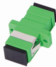
Adapter SC/APC SM simplex CE