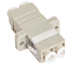
Adapter LC/LC MM duplex CE